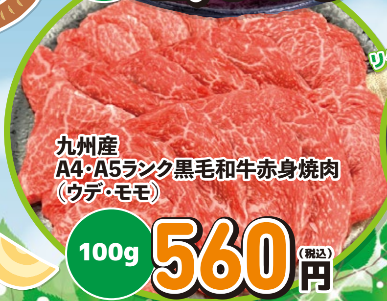
九州産 A4・A5ランク黒毛和牛赤身焼肉 (ウデ・モモ)