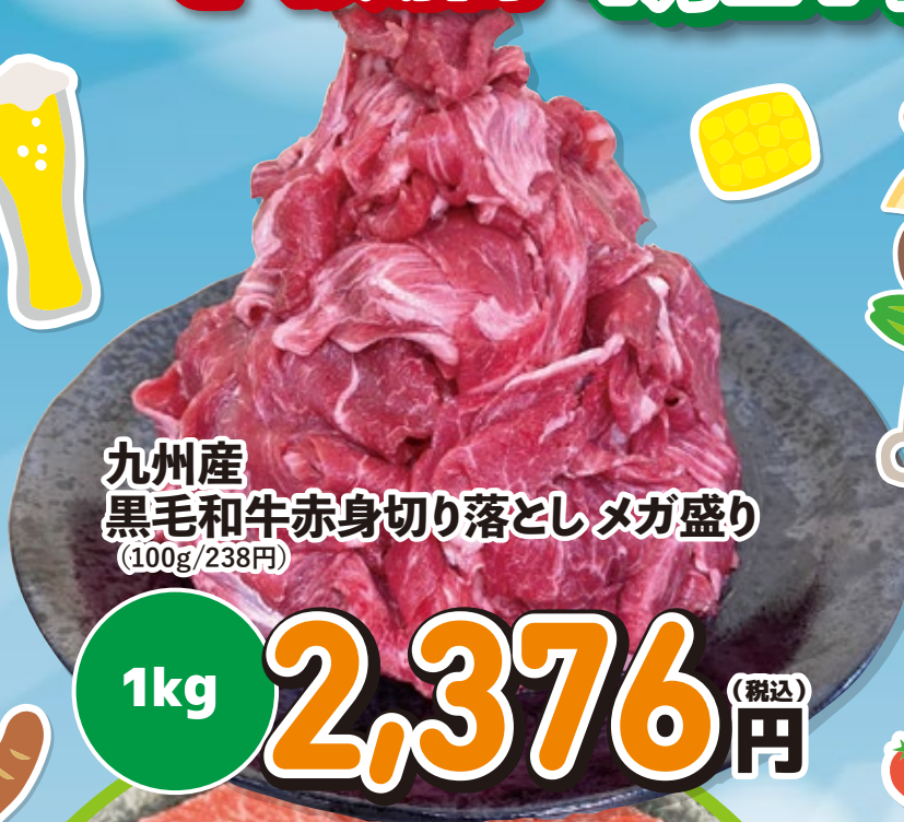
九州産 黒毛和牛赤身切り落としメガ盛り (100g/238円)