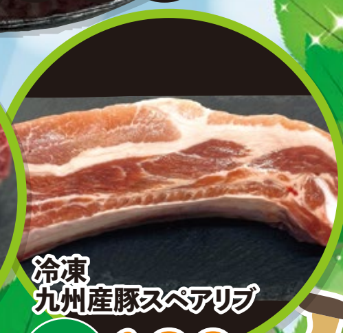
冷凍 九州産豚スペアリブ