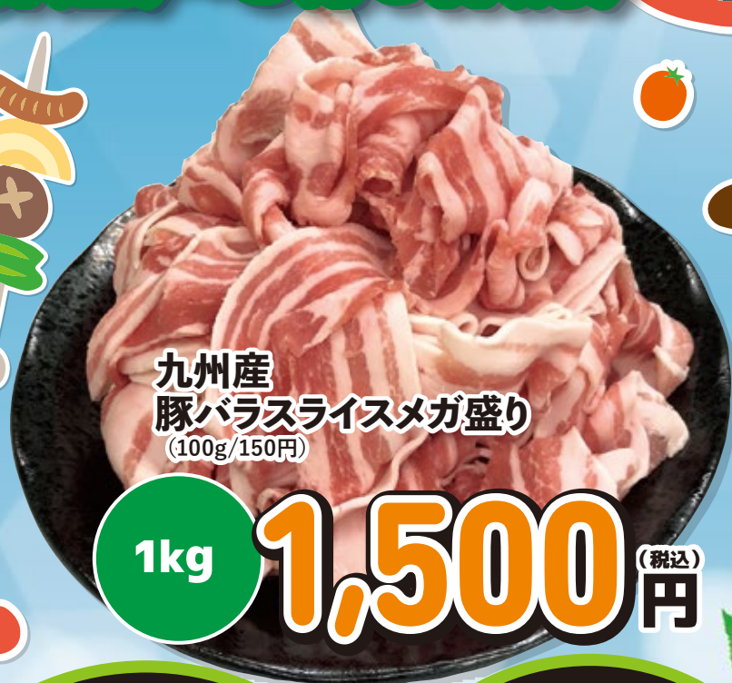
九州産 豚バラスライスメガ盛り (100g/150円)