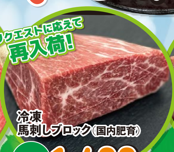
冷凍 馬刺しブロック(国内肥育)